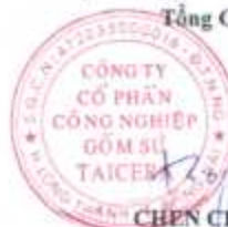
CHEN CHENG JEN